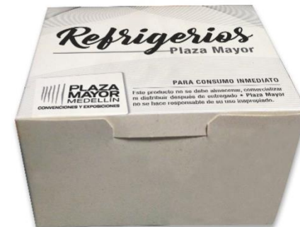
Caja plegadiza individual